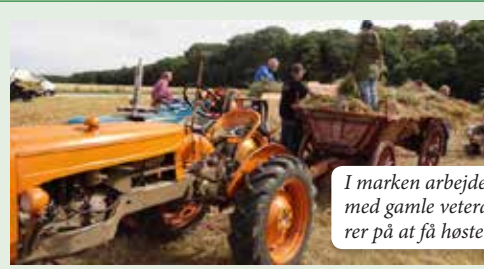
I marken arbejder folkene med gamle veterantraktorer på at få høsten i hus.

Et fjerde træ, vi kunne tale om, er korsets træ. I Flade kirke er der et korbuekors fra middelalderen, hvor Jesus er afbildet på korset og hvor der vokser blade ud på siderne af korset. De fortæller, at dette, for Jesus dødens træ, blev til liv for enhver, som tror og at Jesus ER Livstræet og årsag til, at korset bliver til Livets Træ. Vi er ikke længere forment adgang til Livets Træ. BKS