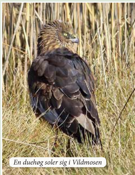
En duehøg soler sig i Vildmosen

På turen vil vi besøge den moderne og interessante Dokkedal kirke, hvor graveren vil fortælle om kirken. Derefter vil vi spise frokost på Lille Vildmosecentret og få en guidet tur med bus i området. Måske kan vi nå at få et kig på de relativt nyankomne elge eller nogle af de mange fuglearter, der holder til i Vildmosen, foruden at høre om stedets historie og den nuværende idé med stedet.